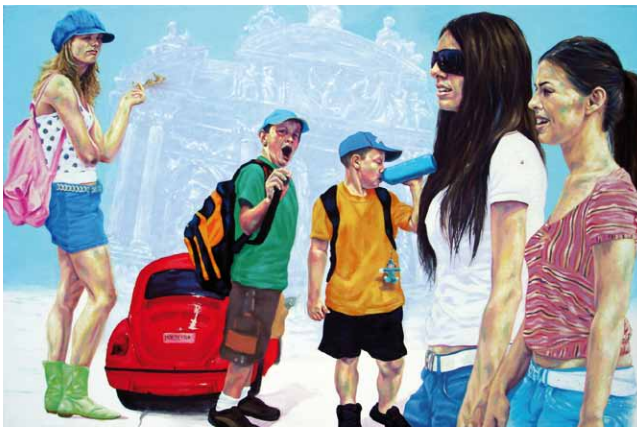
LA FARFALLA DELLA PASTA, Acrylique et Huile sur Toile 150 x 100 cm