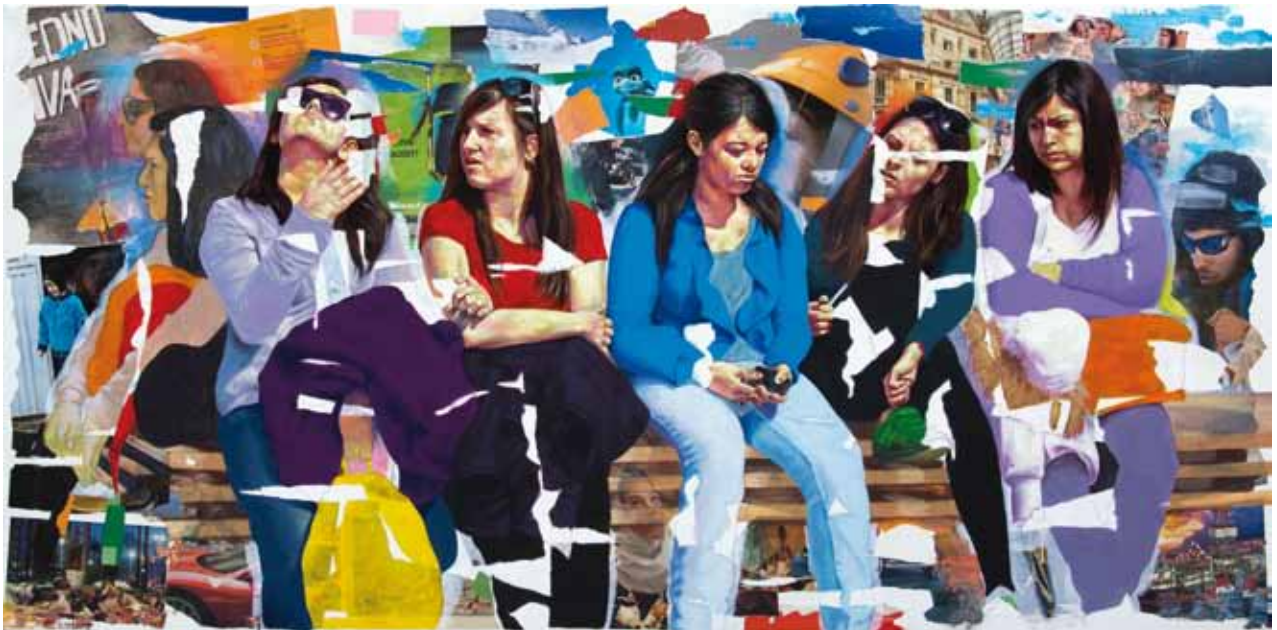
AFTER THE HIGH WATERS, Technique mixte sur toile 182x90 cm