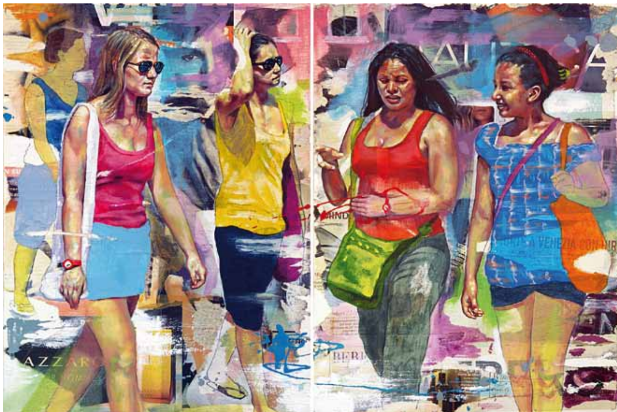
GALUPPI'S SIMPHONY, Technique mixte sur toile 60 x 40 cm