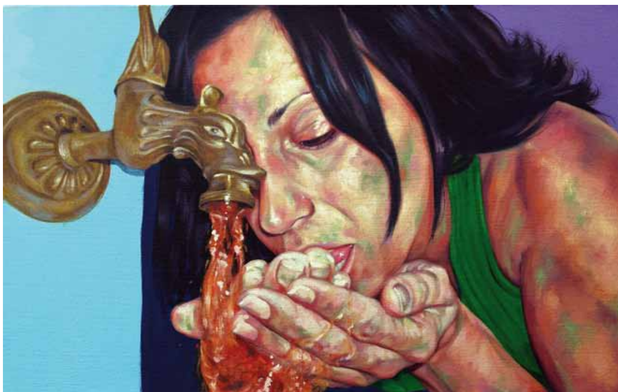
LA FONTANA DI SPRITZ, Acrylique et Huile sur Toile 95 x 61 cm