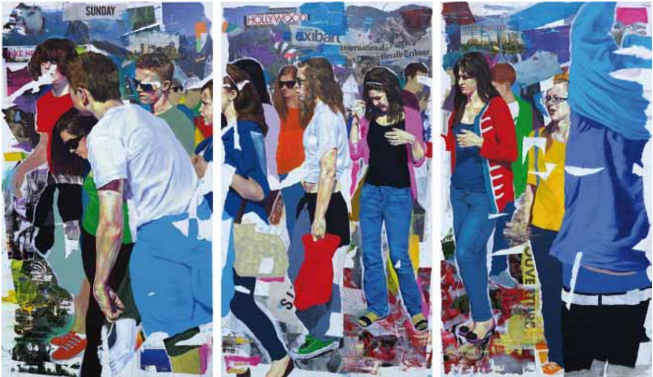
TRITTICO AMERICA, Technique mixte sur toile 225 x 130 cm

A travers un texte que le peintre transalpin a bien voulu nous transmettre, il précise ceci : « En réalité, les sujets sont toujours un prétexte pour "démontrer" de manière subtile l'uniformisation de la jeunesse dans les moments d'exposition publique maximale. La déchirure, le caractère aléatoire, la couleur pulvérisée et appliquée de manière irrégulière entendent réaffirmer le concept. Presque comme si la surface picturale se fragilisait, se détériorait quelque peu, et qu'en cela la couleur avait une valeur superficielle. Comme une grande partie de l'univers de la jeunesse contemporaine. Cette nouvelle génération d'individus, en apparence gaie et insouciant, porte en elle les déchirements et la superficialité de l'uniformisation, en l'extériorisant par des couleurs vives et des attitudes inconscientes de son existence. La référence manifeste aux panneaux publicitaires me sert, à l'inverse de Mimmo Rotella, à contextualiser ma poétique de la superficialité, miroir de la contemporanéité. Des jeunes contre un mur qui se laissent découvrir et détériorer... comme un mur couvert d'une belle fresque et pourtant malade, d'où émerge en quelques endroits, parmi les couleurs brillantes, une ébauche toute simple. »