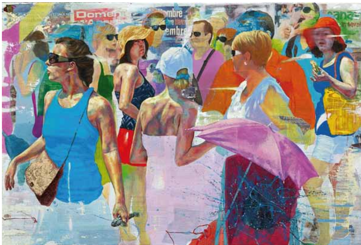
THE POWER OF WATER, Technique mixte sur toile 150 x 100 cm