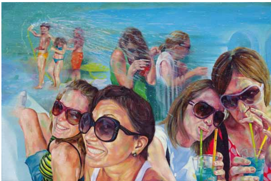
ACQUARIO BENACENSE, Acrylique et Huile sur Toile 100 x 60 cm