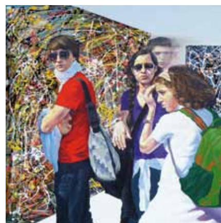
FEVER Omaggio a Jackson Pollock, Technique Mixte sur Toile 90x90cm

Notre monde de la standardisation, de la vitesse, du vacarme et du robinet à images, semble interdire la lenteur, pourtant propice à la méditation. Dans son Hommage à Jackson Pollock (acrylique/huile sur toile, 90 x 90 cm, 2010), Molin montre quatre jeunes visiteurs devant des toiles du maître de l'Action Painting. Ces spectateurs regardent-ils les œuvres ? Que nenni ! Deux portent des solaires, accessoire rendant fort difficile la contemplation et la proximité avec le travail du peintre. Et tous, parés des mêmes manches courtes et des mêmes sacs (à dos ou à bandoulière), sont manifestement plus préoccupés de regarder qui les observe – à savoir nous en tant que regardeurs du tableau de Molin – plutôt que de se laisser surprendre par l'émotion esthétique que peut procurer une œuvre d'art. Si l'on n'y prend garde, la société du spectacle, qui s'associe avec le consumérisme à tout-va, forme un écran qui nous met à distance du monde réel, de ses sensations, subtilités et singularités.