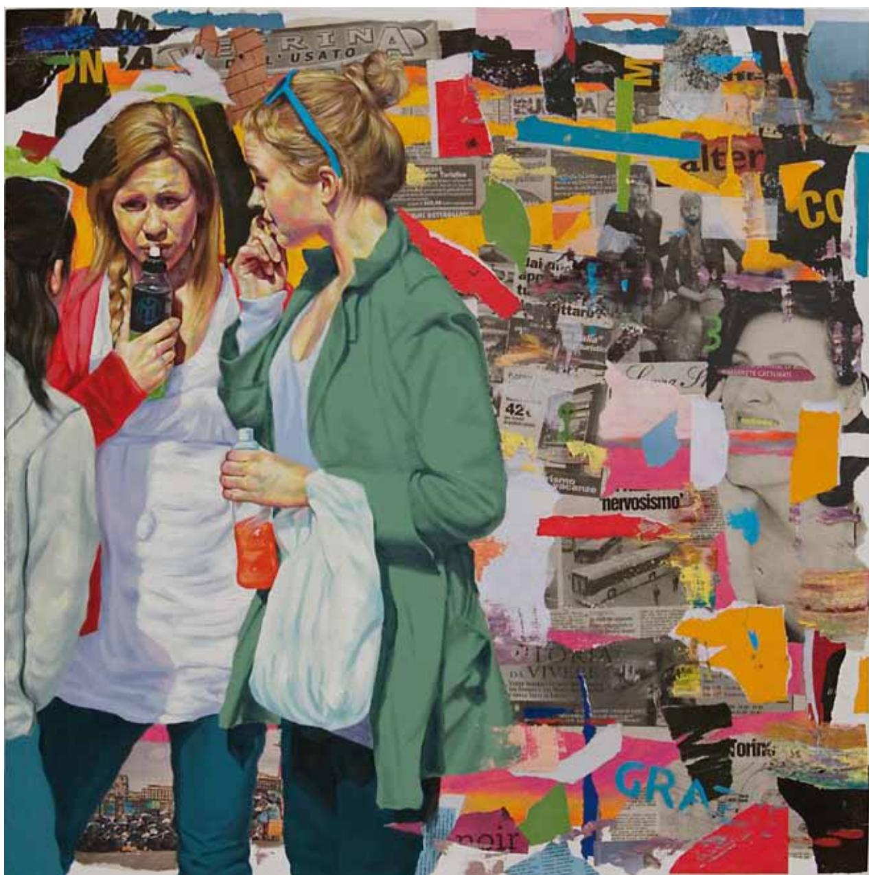
TRE GRAZIE, Acrylique et Huile sur Toile 90 x 90 cm