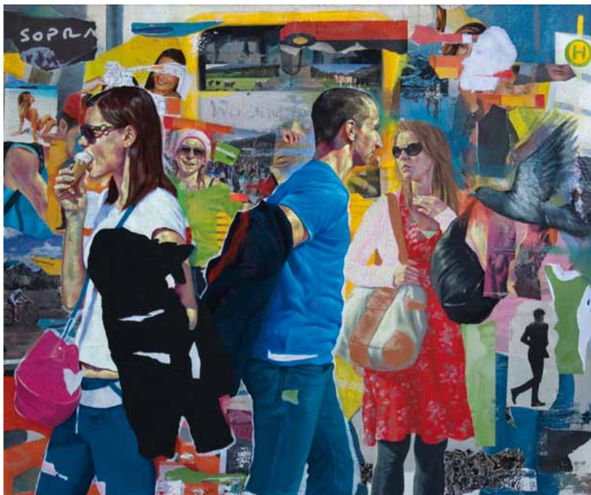
WIR SIN FUR Technique mixte sur toile 160 x 130 cm, 2011

Vernissage le Jeudi 16 Février 2012 de 18h à 21h