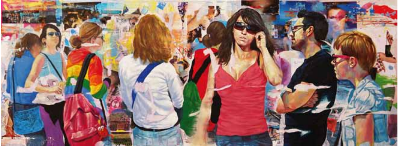
RESERVED FOR YOU, Technique mixte sur toile 150 x 55 cm